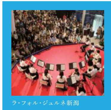
ラ・フォル・ジュルネ新潟

[問い合わせ]新潟市文化政策課 025-226-2565 http://www.city.niigata.lg.jp/kanko/bunka/harufesta/