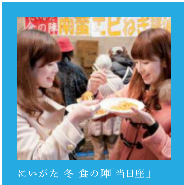
にいがた冬食の陣「当日座」

26日18:30~ 会場:市民プラザ 28日14:00~ 会場:江南区文化会館 ※各日公演約1時間30分 中国の旧正月「春節」にあわせて、友好都市ハルビン市の交響楽団による無料公演を実施します。100年以上の歴史を誇る由緒ある楽団が友好都市35周年の祝賀ムードを盛り立てます。(要事前申込(2/16までに、はがきまたはFAXにて)) [問い合わせ]新潟市国際課 025-226-1675