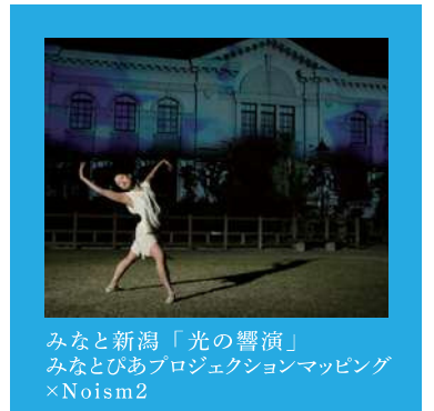
みなと新潟「光の響演」 みなとびあプロジェクションマッピング ×Noism2

【お問い合わせ】「東アジア文化都市2015新潟市」実行委員会事務局 Tel / 025-226-2554・Fax / 025-230-0450・E-mail / ea.bunka@city.niigata.lg.jp 〒951-8550 新潟市中央区学校町通1番町602番地1 新潟市文化政策課内