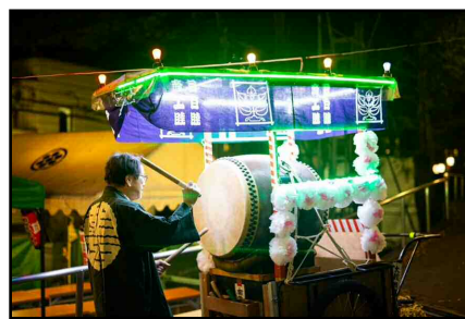
Oeshiki Project