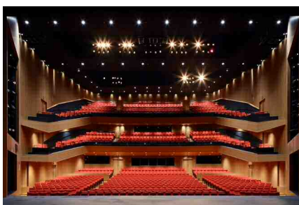
東京建物 Brillia HALL