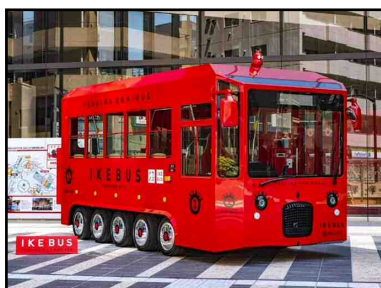
IKE BUS