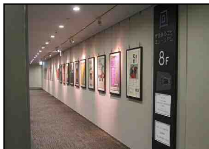
庁舎まるごとミュージアム

庁舎建物の3階から9階までの回廊状の廊下を利用し、庁舎をまるごと「ミュージアム」に見立てて、豊島区にゆかりのある文化・芸術や区の事業等、幅広い展示を展開しています。視察では、東アジア文化都市2019豊島関連企画をご覧ください。いただくことができます。